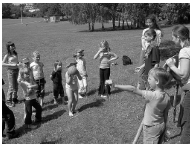
Vaikams - smagių rungtių ir prizų metas.